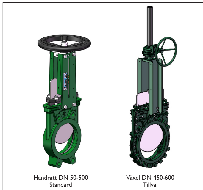
Handratt DN 50-500 Standard